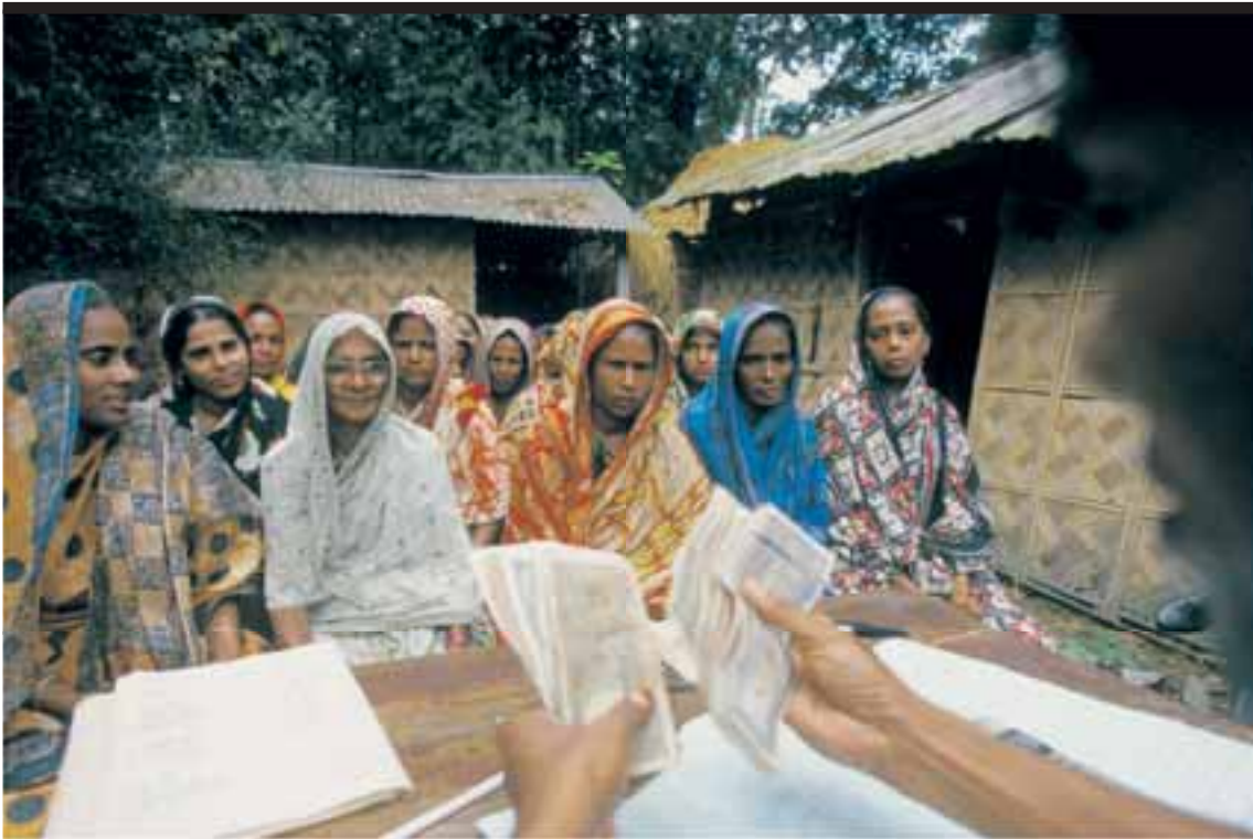
Dans un village du Bangladesh, des femmes reçoivent des prêts de la Grameen Bank. L'institution fondée par Muhammad Yunus (à droite) a fait école dans le monde entier.

La remise du prix Nobel de la paix, dimanche à Oslo, au Bangladais Muhammad Yunus et à sa Grameen Bank va donner un spectaculaire coup de projecteur sur le microcrédit. Cette formule originale de petits prêts inventée par le « banquier des pauvres » et qui a essaimé dans le monde entier est parfois perçue comme une panacée pour le développement. En réalité, ses effets économiques sont modestes. Et c'est au niveau social que son impact est profond.